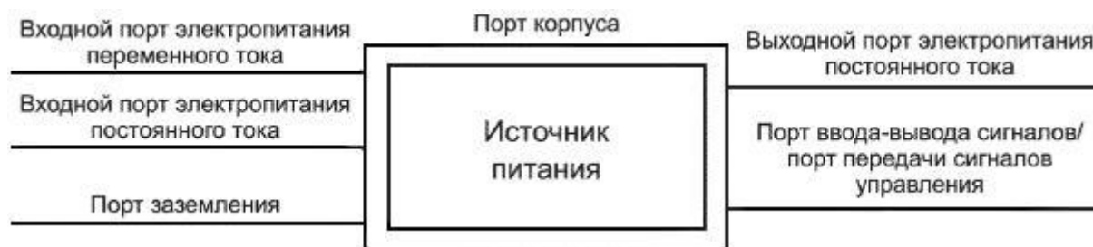
Рисунок 1 - Примеры портов источника питания