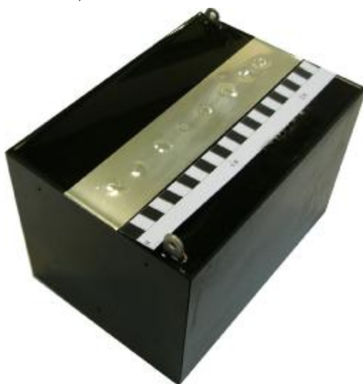
Фото 2. Модуль 200 В, 18 кДж. (линейка наверху в сантиметрах)