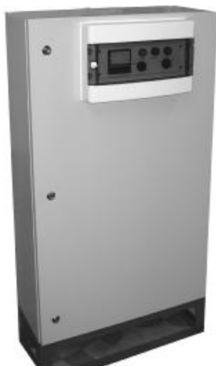
Фото 4. КТН-100

Общий вид стойки КТН-100 приведён на фото 4