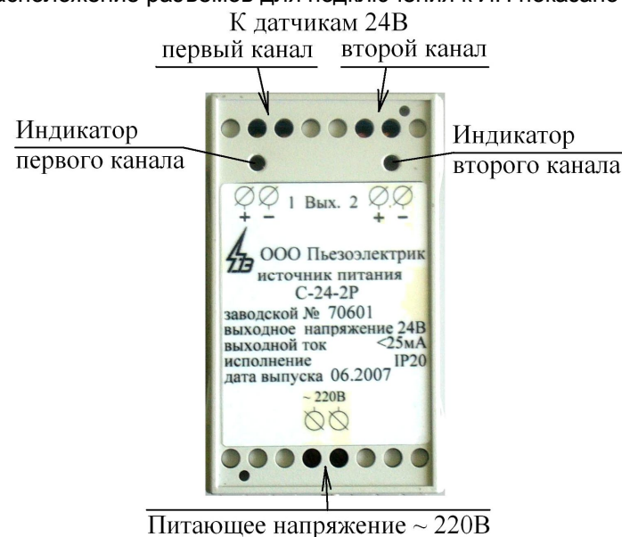
Рис. 1 – расположение разъемов ИП.

Расположение разъемов для подключения к ИП показано на рис. 1.